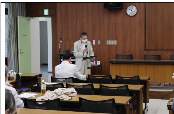
総会の進行は鳥海執行役員です。