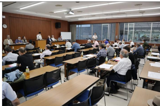
120人定員の会場は適切なディスタンスがとられています。