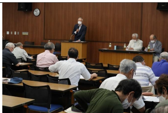
阿部代表理事のあいさつ